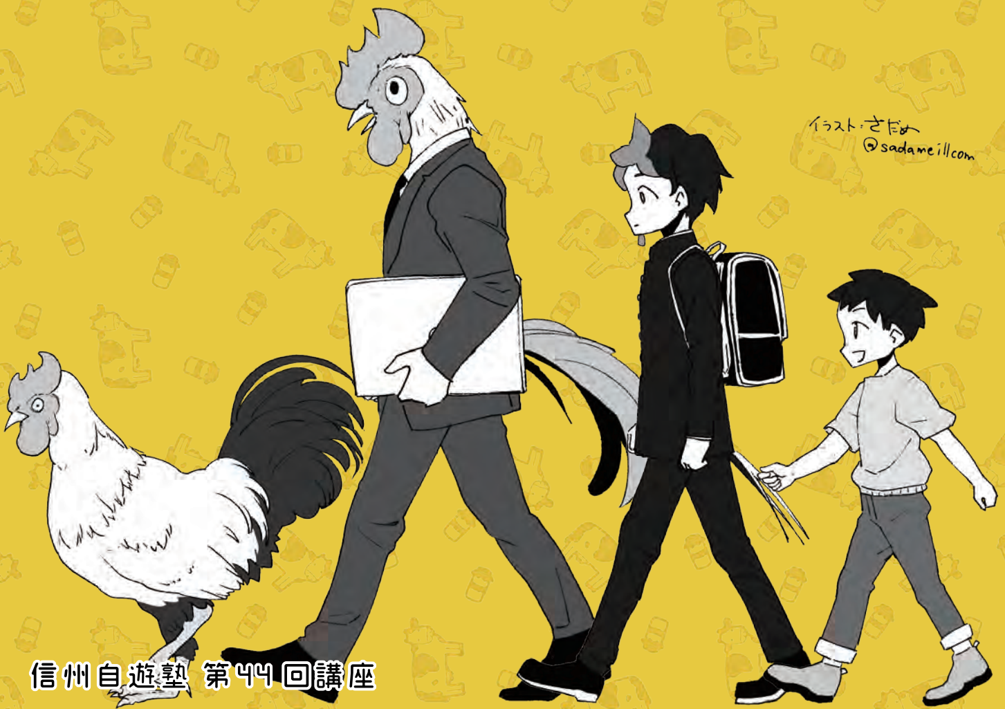
イラスト: さだめ @sadameill.com